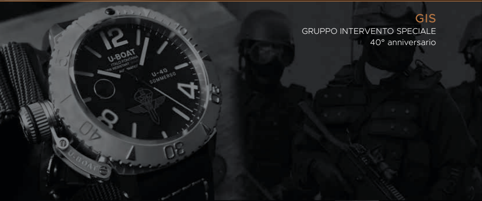
GIS GRUPPO INTERVENTO SPECIALE 40° anniversario