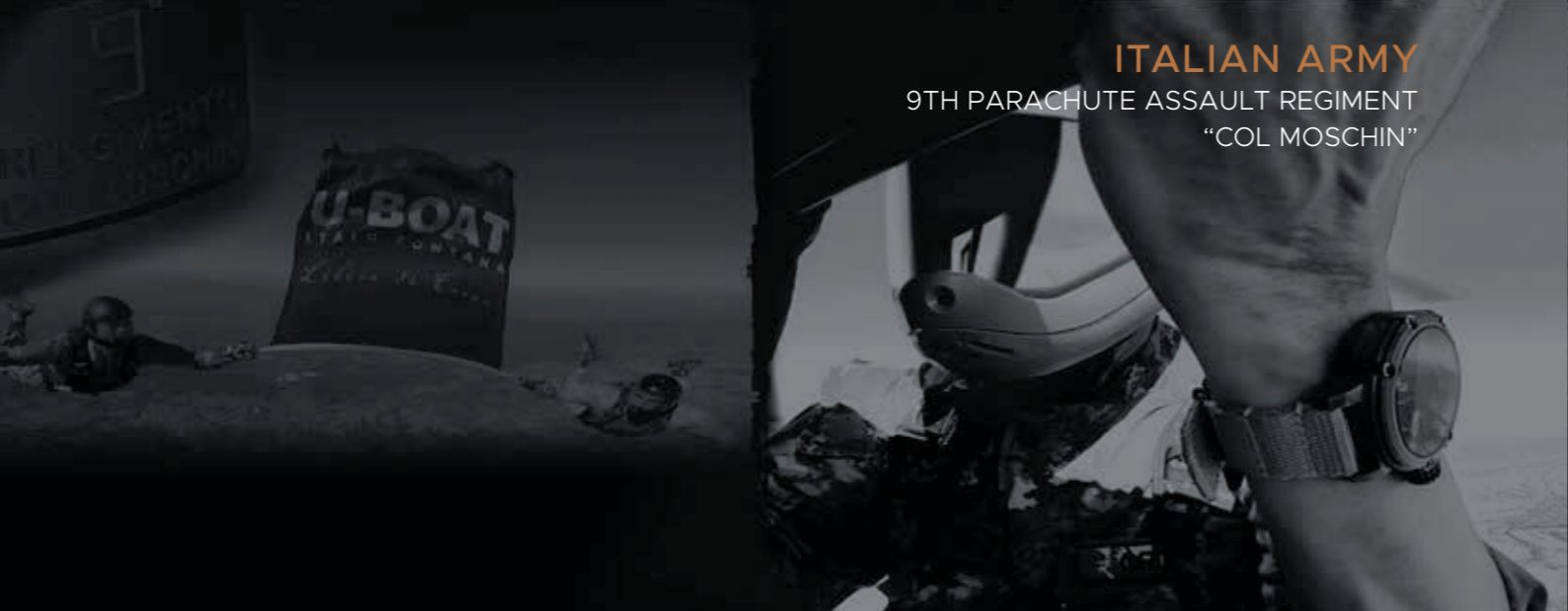
ITALIAN ARMY 9TH PARACHUTE ASSAULT REGIMENT "COL MOSCHIN"