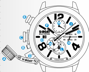
Immagine indicativa. Alcuni componenti possono non essere presenti o presenti in diversa posizione.