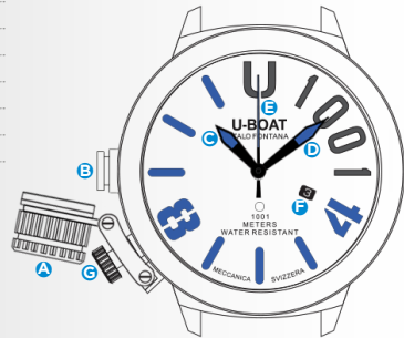
Immagine indicativa. Alcuni componenti possono non essere presenti o presenti in diversa posizione.