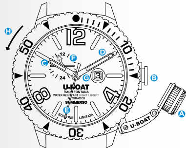
Immagine indicativa. Alcuni componenti possono non essere presenti o presenti in diversa posizione.