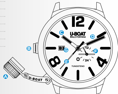
Immagine indicativa. Alcuni componenti possono non essere presenti o presenti in diversa posizione.